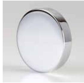
Kappe Desing rund Cap design round Conception cap autour Caps design intorno Cap ontwerp rond Cap diseno alrededor