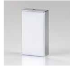
Kappe Design eckig S Cap design square S Cap forme rectangulaire S Cap design rettangolare S Cap ontwerp rechthoekig S Cap diseno rectangular S