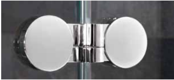
Band Glas/Glas 180° - Kappen Desing rund | Hinge glass/glass 180° - Caps design round | Bande de verre/verre 180° - Conception cap autour | Banda di vetro/vetro 180° - Caps design intorno | Band Glas/glas 180° - Caps ontwerp rond | Banda de vidro/vidro 180° - Caps diseno alrededor