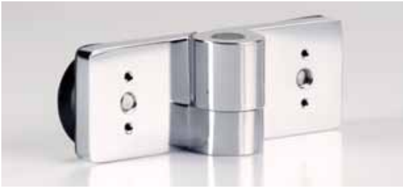
Band Glas/Glas 180° | Hinge glass/glass 180° | Bande de verre/verre 180° | Banda di vetro/vetro 180° | Band Glas/glas 180° | Banda de vidro/vidro 180°