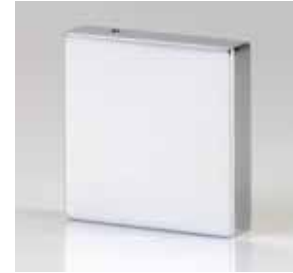
Kappe Design eckig L Cap design square L Cap forme rectangulaire L Cap design rettangolare L Cap ontwerp rechthoekig L Cap diseno rectangular L