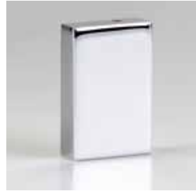
Kappe Design eckig M Cap design square M Cap forme rectangulaire M Cap design rettangolare M Cap ontwerp rechthoekig M Cap diseno rectangular M

Bovendien zorgen doorlopende dichtingen aan alle verticale randen voor een perfecte afdichting.